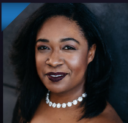
MTRA. MICHELLE CANN CURTIS INSTITUTE OF MUSIC (ESTADOS UNIDOS) CLASES MAESTRAS PRESENCIALES